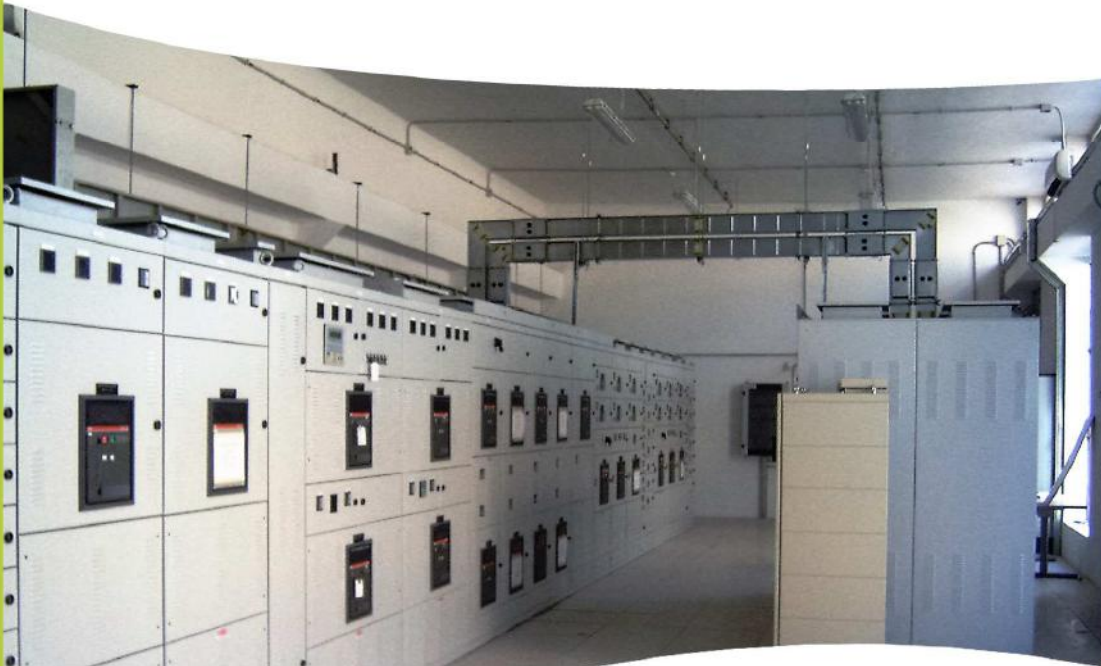
Realizzazione impianto distribuzione BT. Power Center - Blindo Sbarre

Gigawatt s.r.l., nata da un'ormai affermata tradizione impiantistica industriale iniziata nel 1983 in risposta alle crescenti esigenze e sollecitazioni di mercato ha saputo evolversi nella progettazione e nella realizzazione di impianti per la distribuzione dell'energia elettrica in Media e Bassa tensione.