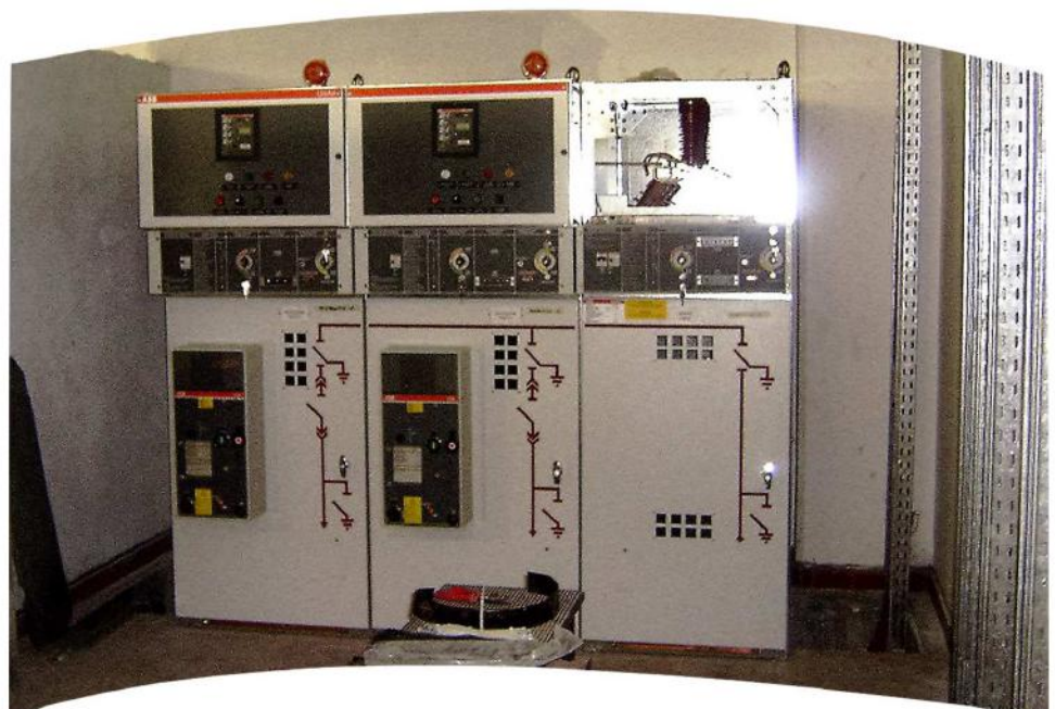
Realizzazione cabina MT Operatore Telefonico

Presente da sempre sul territorio nelle attività di impiantistica residenziale e industriale, avvalendosi di tecnologie e parthenr specializzati nei rispettivi settori, si pone come unico interlocutore garantendo il massimo rendimento e minimizzando i costi.