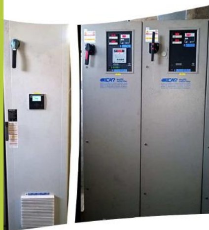
Realizzazione rifasamento sito siderurgico