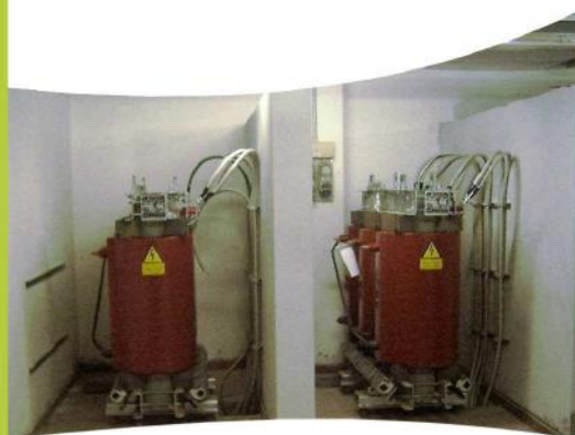
Realizzazione impianto di trasformazione cabina operatore telefonico