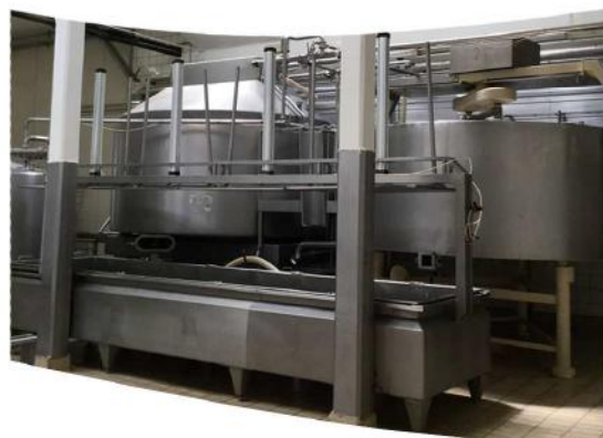
Realizzazione quadri speciali industria casearia